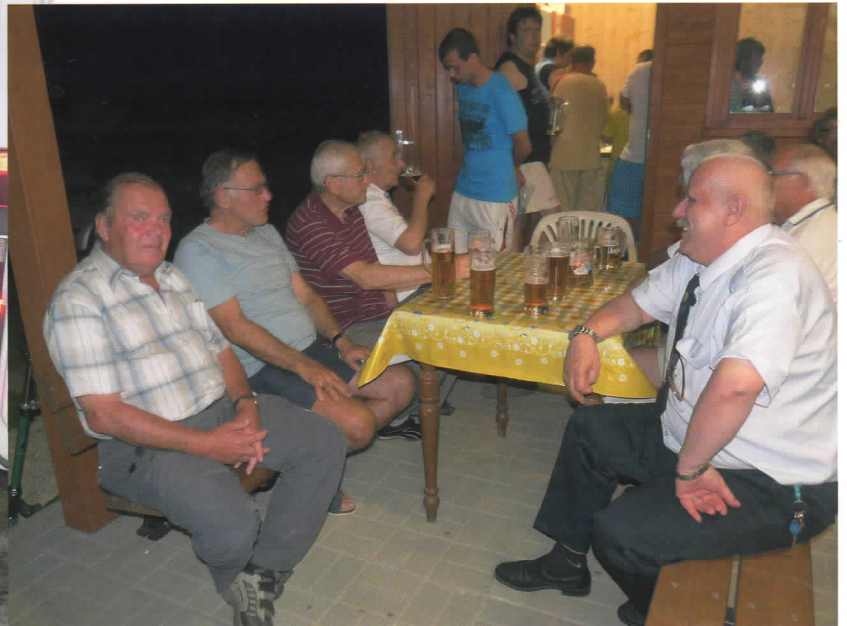
Bavit se přišli starší i mladší.